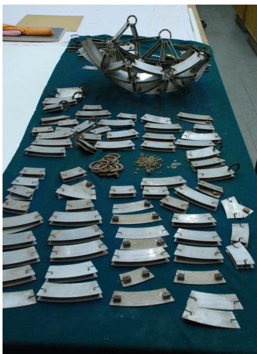
Ievas Soprānes restaurētais Valda Celma darbs “Ceturtnā pakāpe” restaurācijas procesā, gatavojoties izstādei “Kinētikas arheoloģija” (2016)