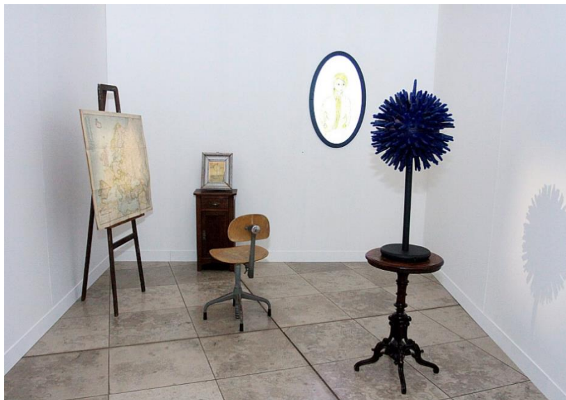
2018 "Nākotnes valsts" izstāžu zālē "Arsenāls", projekts "Nākotnes valsts pilsonis" ar Rīgas Kultūru vidusskolas audzēkņu piedalīšanos