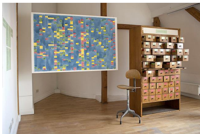
2014. „Latvijas laikmetīgās mākslas DNS” izstāde LMC Ofisa galerijā, izmantojot skolnieku recenziju fragmentus, kuros vērtēta Latvijas laikmetīgā māksla