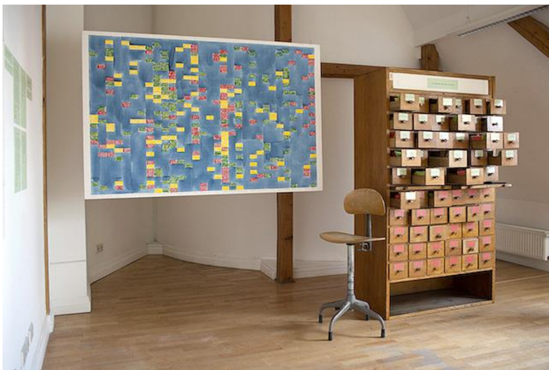
2014., „Latvijas laikmetīgās mākslas DNS” izstāde LMC Ofisa galerijā, izmantojot skolnieku recenziju fragmentus, kuros vērtēta Latvijas laikmetīgā māksla

Starppriekšmetu saikne – ģeogrāfija, kulturoloģija, arhitektūra, futuroloģija, kultūras vēsture, pedagogija