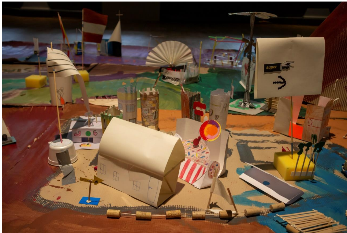
Mākslinieces Izoldes Cēsnieces vadīta nākotnes ģeogrāfijas meistardarbnīca Valmieras Vasaras teātra festivālā.