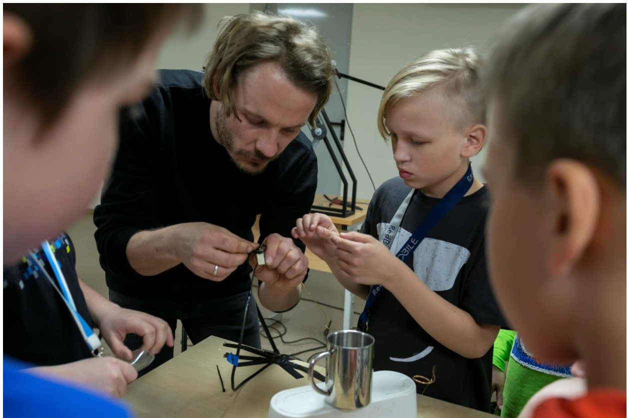
Modra Svilāna vadīta meistarklase Laurenču sākumskolas skolēniem. Foto: Didzis Grodzs, Latvijas Laikmetīgās mākslas centrs, 2019